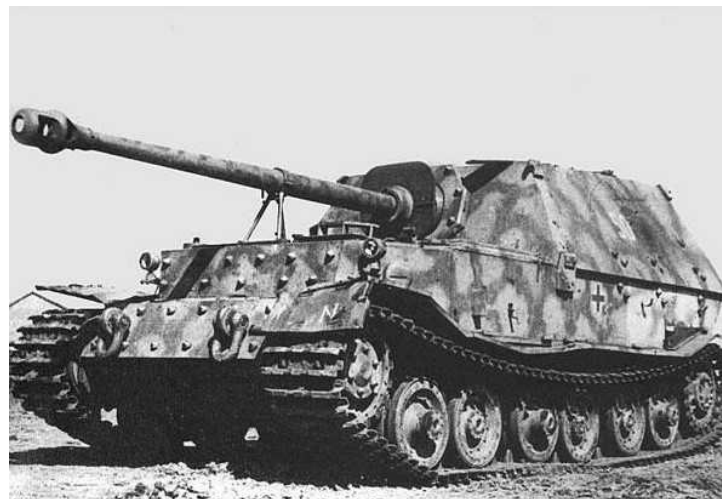
Niemiecki ciężki niszczyciel czołgów Sd.Kfz. 184