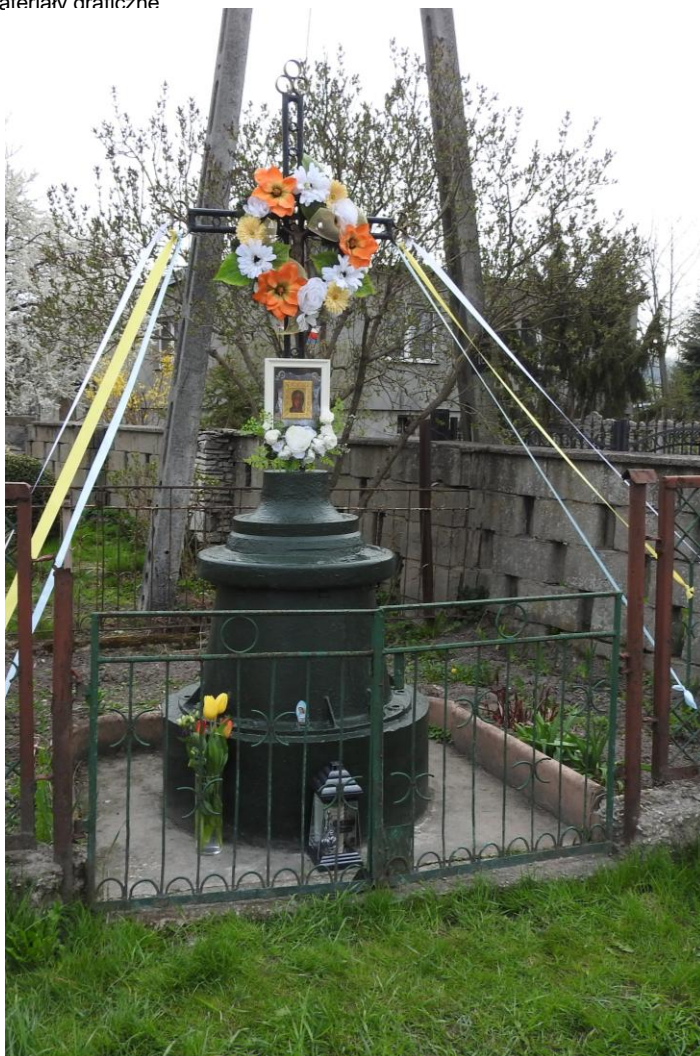
Widok ogólny krzyża od strony wschodniej.